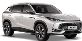
STERLING srebrna 500,00 €