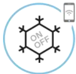
Aplikacija za daljinsko upravljanje