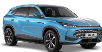
ARCTIC plava Bez naknade