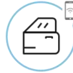
Zaključavanje/ otključavanje vozila