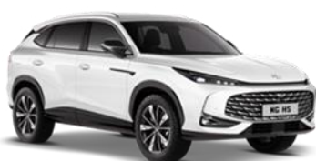
PEARL bijela 500,00 €